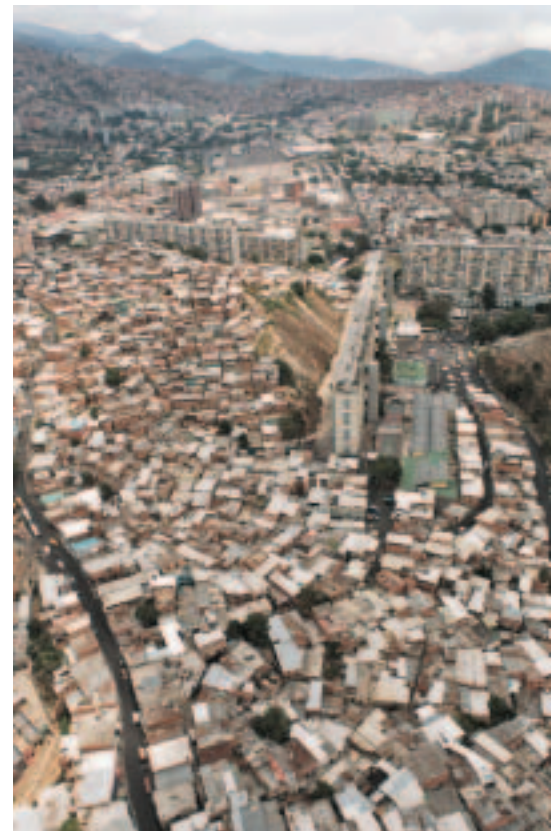
1, 2 Caracas, 23 de Enero, 2003 (Architektur: Carlos Raúl Villanueva, 1952)